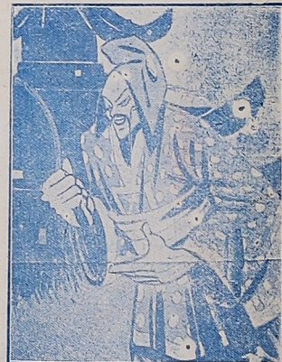
La República china: —Este gorro me sienta bien. «Pasquino», Turín.