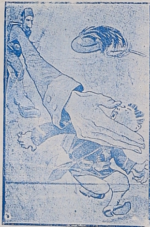
El conflicto italturco, según se juzga en Turquía «Kikeriki», Viena.