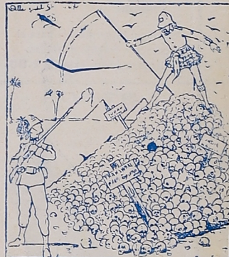
John Bull al italiano.—¡Qué barbaridad! Un soldado europeo se atreve a matar a los turcos en pleno siglo XX, con el pretexto de colonizar. «Fischietto», Turín.