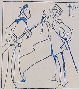
El ramo de olivo ofrecido por Inglaterra, no será aceptado tan fácilmente por Alemania. «Fischietto», Turín.