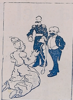
—Perdonadme y no os riáis, que la cosa no es para risa. Si me veis así, es porque creo que este traje es ya el único que puedo llevar. «El Colmillo», México.