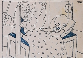
¡Buen aguinaldo! «Multicolor», México.