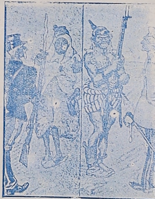
Primeros ejercicios de los futuros ejércitos de Marruecos y el Congo «Lustige Blatter», Berlín.