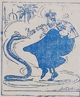
El Encantador de la India «The Interocean», Chicago.