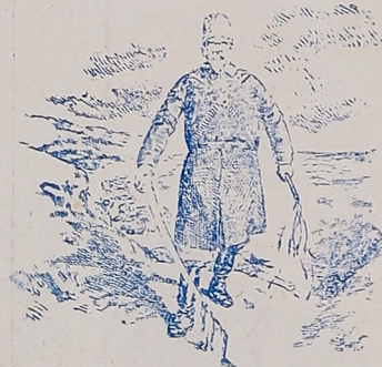
Los progresos de la civilización.—(Rusia en Persia) «The World», New York.