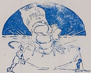
El armisticio «The Boston Sunday Herald».