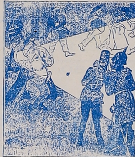
LA MISMA HISTORIA DE SIEMPRE.—El nuevo Diogenes (Persia) busca en vano un amigo honrado. «Kikeriki», Viena.