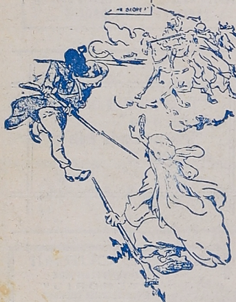
El turco.—Esperad un momento. El italiano.—Cualquiera los espera. «Sunday Herald», Boston.