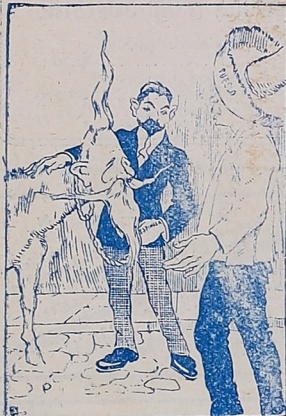
Pueblo.—El que no lo conozca que lo compre «Ypiranga», México.