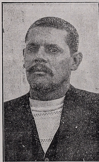
El famoso exgeneral revolucionario de Sinaloa Don Juan Banderas, actualmente preso en la cárcel de Santiago.

La navidad de los papeleros. —Presidida por la distinguida esposa del Sr. Presidente de la República, doña Sara Pérez de Madero, y por el Sr. teniente Coronel Vito Alessio Robles, Inspector General de Policía, tuvo verificativo el día 31 de diciembre último, en la Escuela Taller de San Felipe de Jesús, la fiesta de navidad