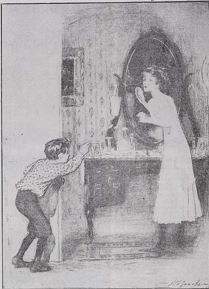
UN SECRETO PELIGROSO EN MANOS DE UN ENEMIGO El hermanito: ¡Te estás pintando.....!—«Life», New York.

Las letras aparecen claras y distintas y pueden leerse con fijar una la atención en las pupilas. Las letras parecen manuscritas; pero la forma correcta y hermosa.