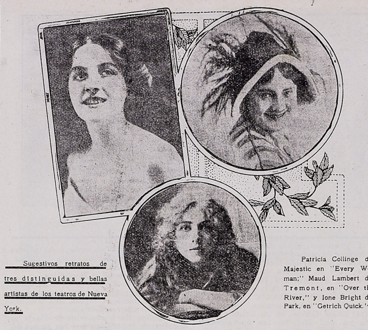
Sugestivos retratos de tres distinguidas y bellas artistas de los teatros de Nueva York.