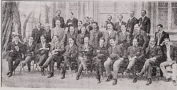
Grupo de comensales que asistieron al banquete ofrecido al maestro Gustavo Campa en el Tivoli del Ellssee, siendo invitado de honor el señor Ministro de Instrucción Pública y Bellas Artes.

La figura que se destaca con más relieve, resultando como de un fondo de ónix mexicano, en exuberante elegancia y desarrollo proporcional de la silueta armoniosa, es la de la señora Eugenia Torres, nuestra primera actriz mexicana.