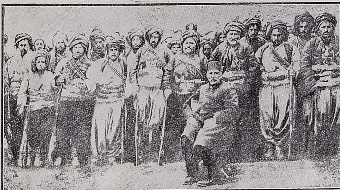
Soldados persas al mando de un general turco, que ha tomado ingerencia importante en los recientes acontecimientos políticos entre Rusia y Persia

El día último del año renunció el Gabinete turco a consecuencia de los obstáculos que oponían los opositoristas, pues los miembros de dicho partido se ausentaron de la Cámara cuando se discutían los proyectos de reformas a la Constitución.