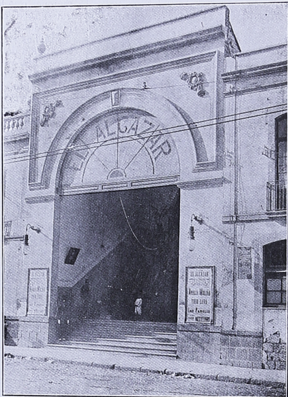
Exterior del Teatro "Alcázar."