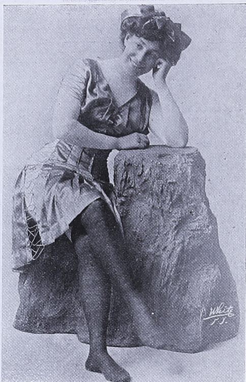
Venus.—La Roca de las Edades.