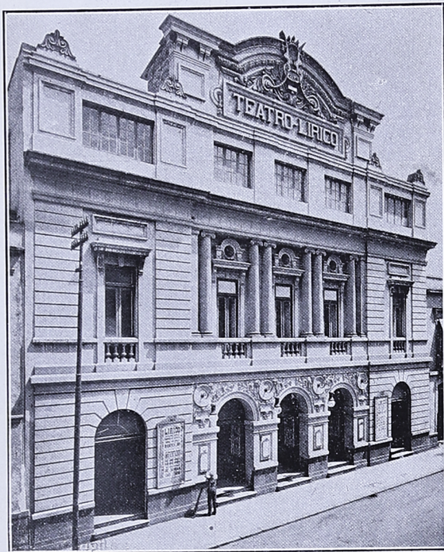
Fachada del Teatro "Lirico."

De que no hay nada imposible, es una viva demostración lo que actualmente acontece en el flamante coliseo de la calle del Aguila.