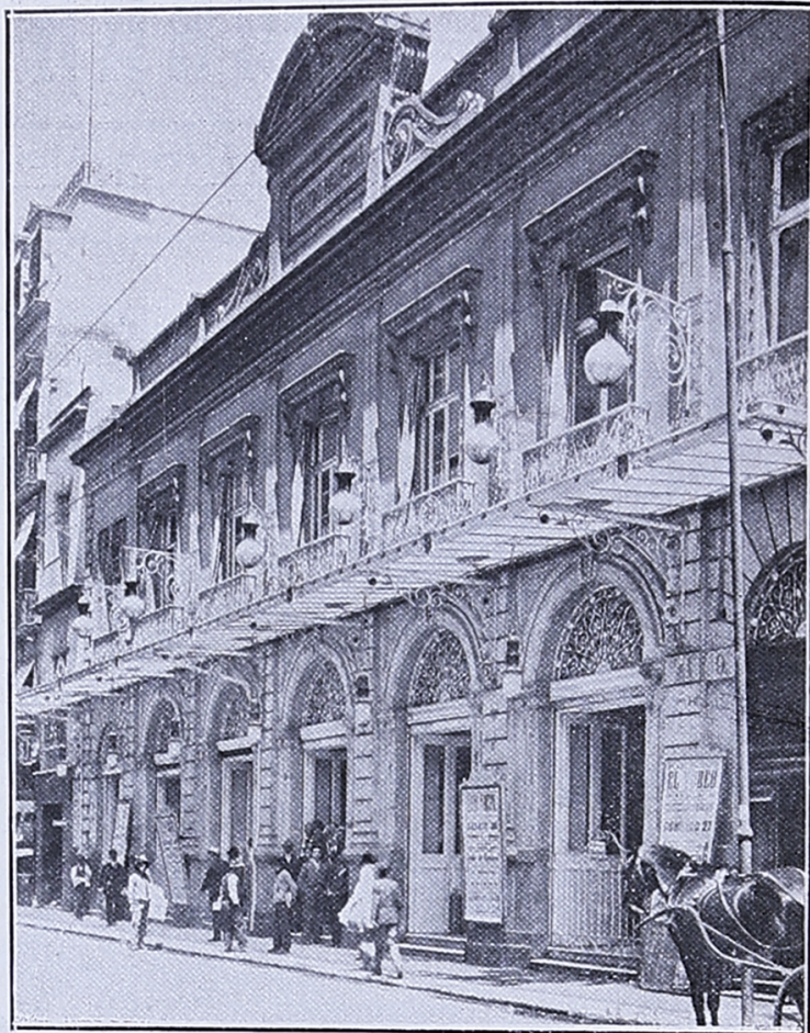
Fachada del Teatro «Principal.»