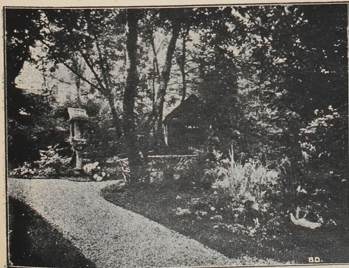
Pedagogium Español.—Un rincón del jardín.

El Pedagogium está dirigido y administrado por un comité constituido en esta forma: