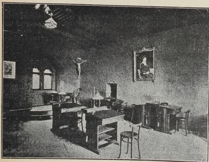
Pedagogium Español.—Sala de estudio.

ta Doña Paz pensó en trasplantar la cultura alemana, la más sólida y patriótica del mundo a la patria española y arbitró, imponiéndose sacrificios de todas clases, que sólo conocemos los que hemos podido admirarlos, la manera de que niños pobres, españoles, desvalidos, condenados por la desgracia a ignorarlo todo, no sólo lo aprendieran, sino que fueran los encargados, andando el tiempo, de difundir entre sus paisanos la ilustración y la cultura que el amor les proporcionó.