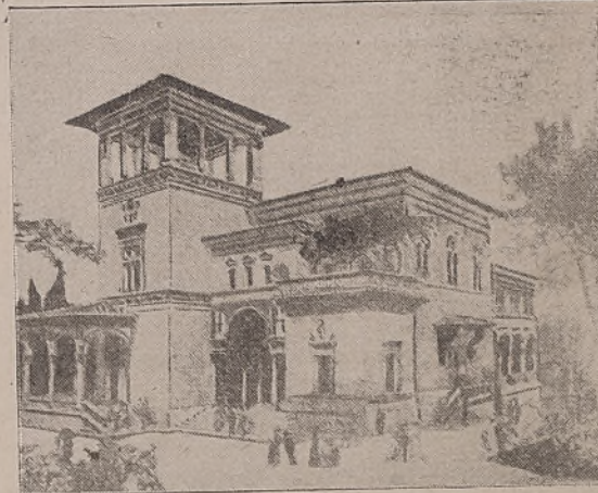
El Pabellón alemán en la Exposición de Roma.

«Como, una exposición en Roma! Un acontecimiento impregnado de modernismo en la ciudad de los recuerdos!»