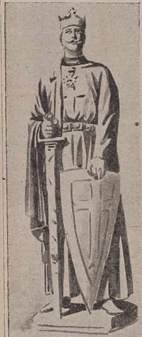
Guillermo II, soberano por "derecho divino."

ren servir de los medios empleados por la gloriosa revolución de 1789: ante todo los junkers, en seguida los "Calotins" y finalmente los príncipes. M. Ledebour ha osado hoy reclamar abiertamente el advenimiento de la República por la revolución.