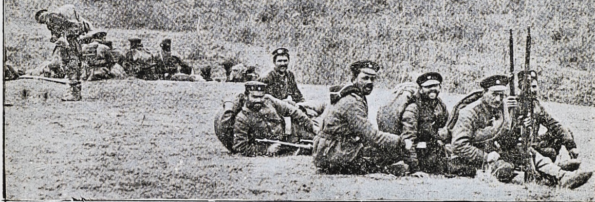
Puestos avanzados de las fuerzas búlgaras frente a los fuertes de Adrianópolis.