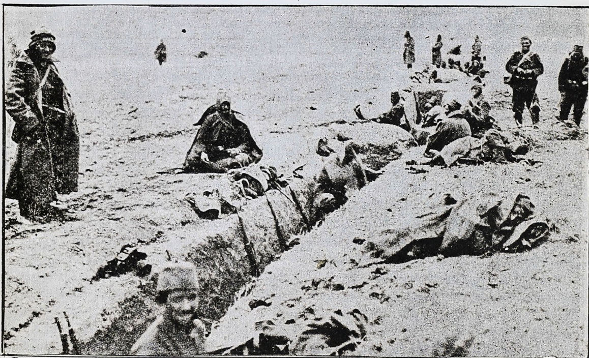
Fosos de defensa cavados en los alrededores de Constantinopla por el ejército turco.