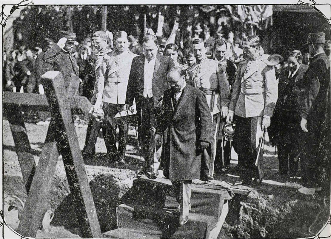
El Sr. Presidente de la República en la ceremonia de la colocación de la primera piedra del monumento á Cerdán.