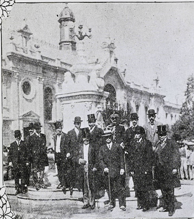
El Gobernador del Distrito, al recibir la fuente construida en la Plaza de San Juan por "El Buen Tono"