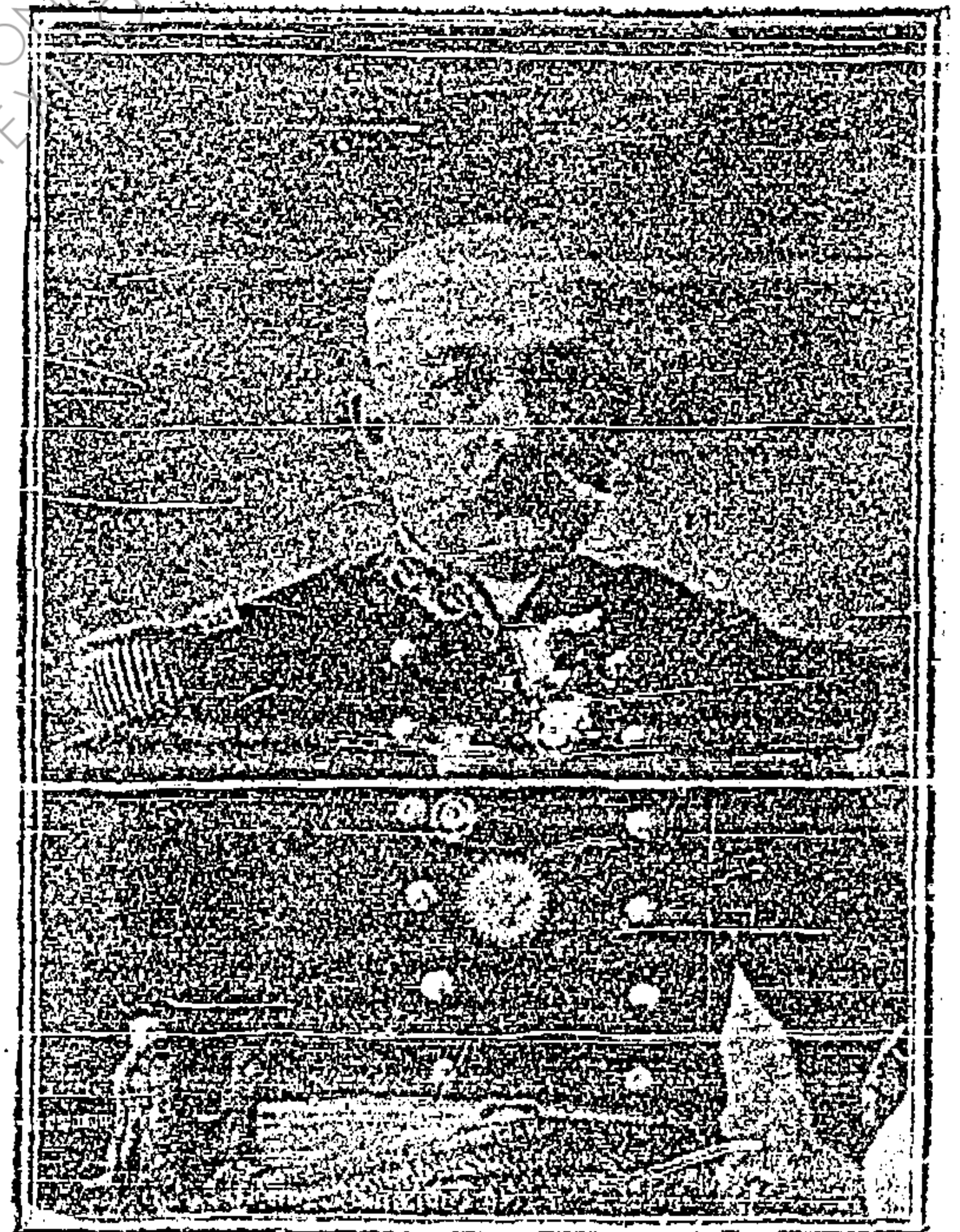
GRAL. JOSÉ MA. MIER.

El hecho de más trascendencia que ha tenido lugar en nuestro estado, en los últimos 20 años, ha sido el cambio de Gobernador, comentado en todos los tonos por la prensa diaria; damos al pú-