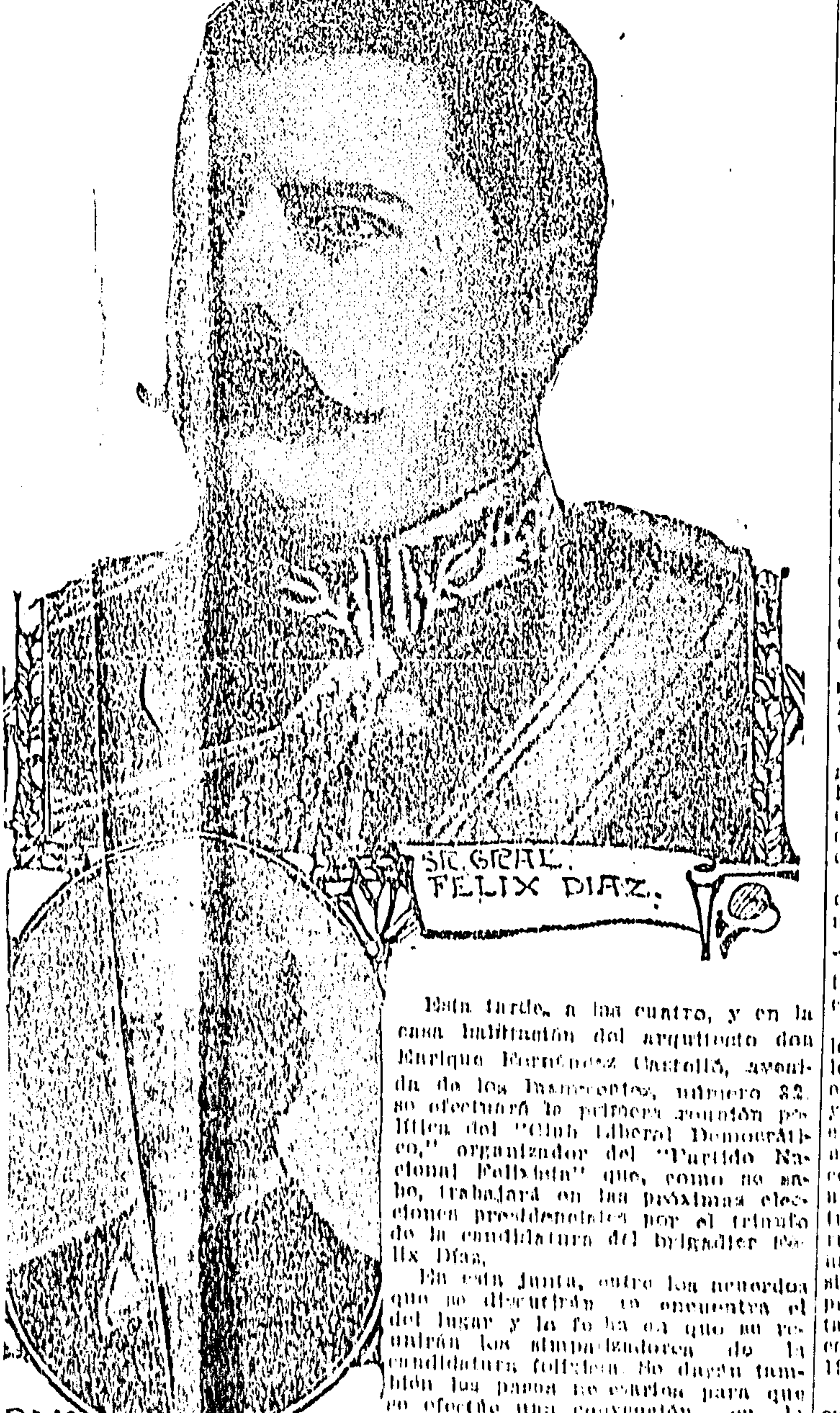
Sr. GENRAL FELIX DIAZ.