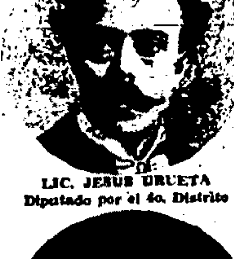
LIC. JESUS ORUETA Diputado por el 4o. Distrito