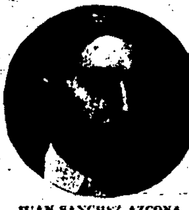
JUAN SANCHEZ AZCONA Primer Senador Proprietario