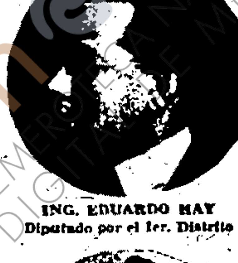
ING. EDUARDO MAY Diputado por el 1er. Distrito