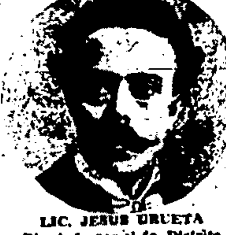
LIC. JESUS ORUETA Diputado por el 4o. Distrito