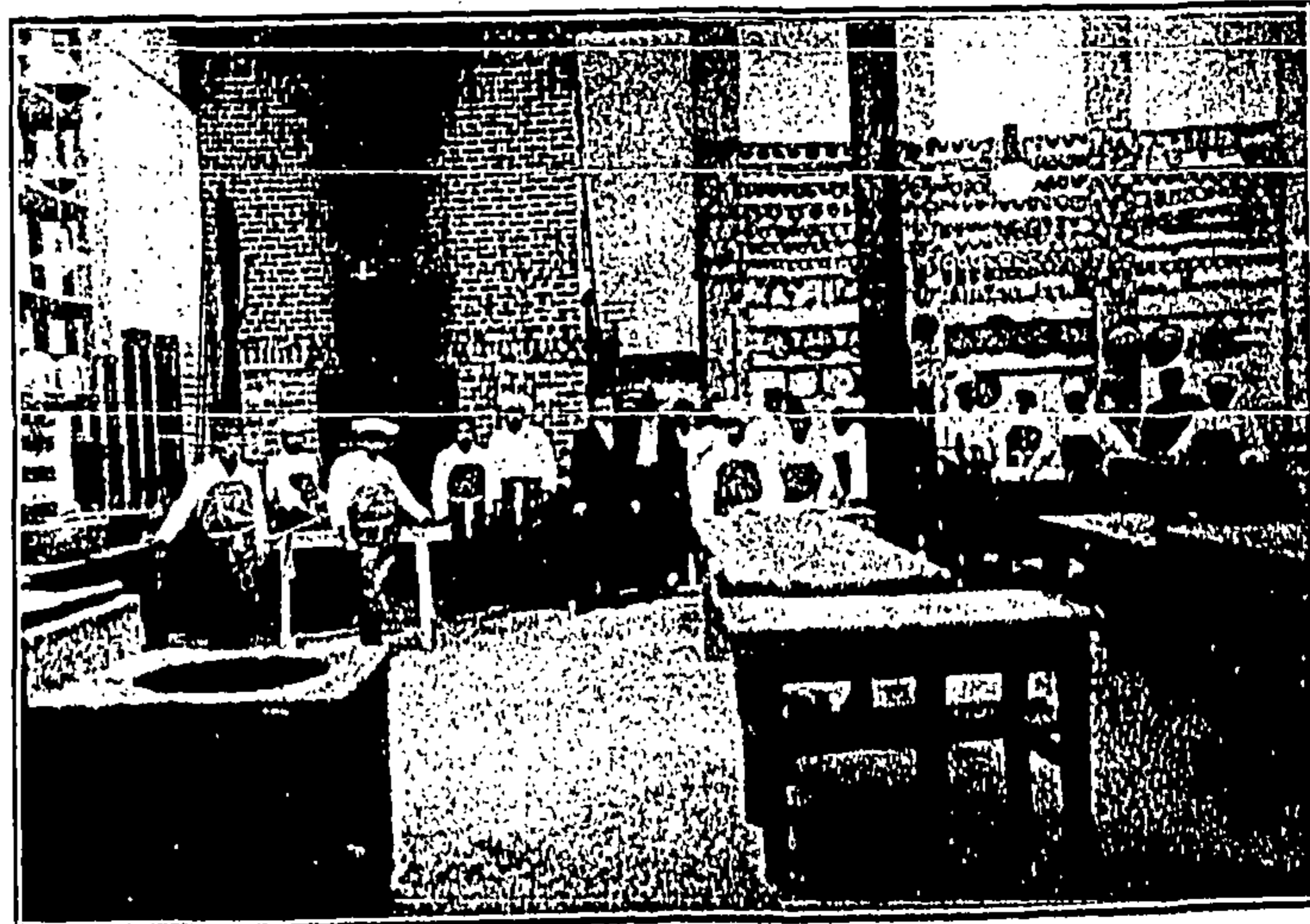
Talleres de "El Globo."