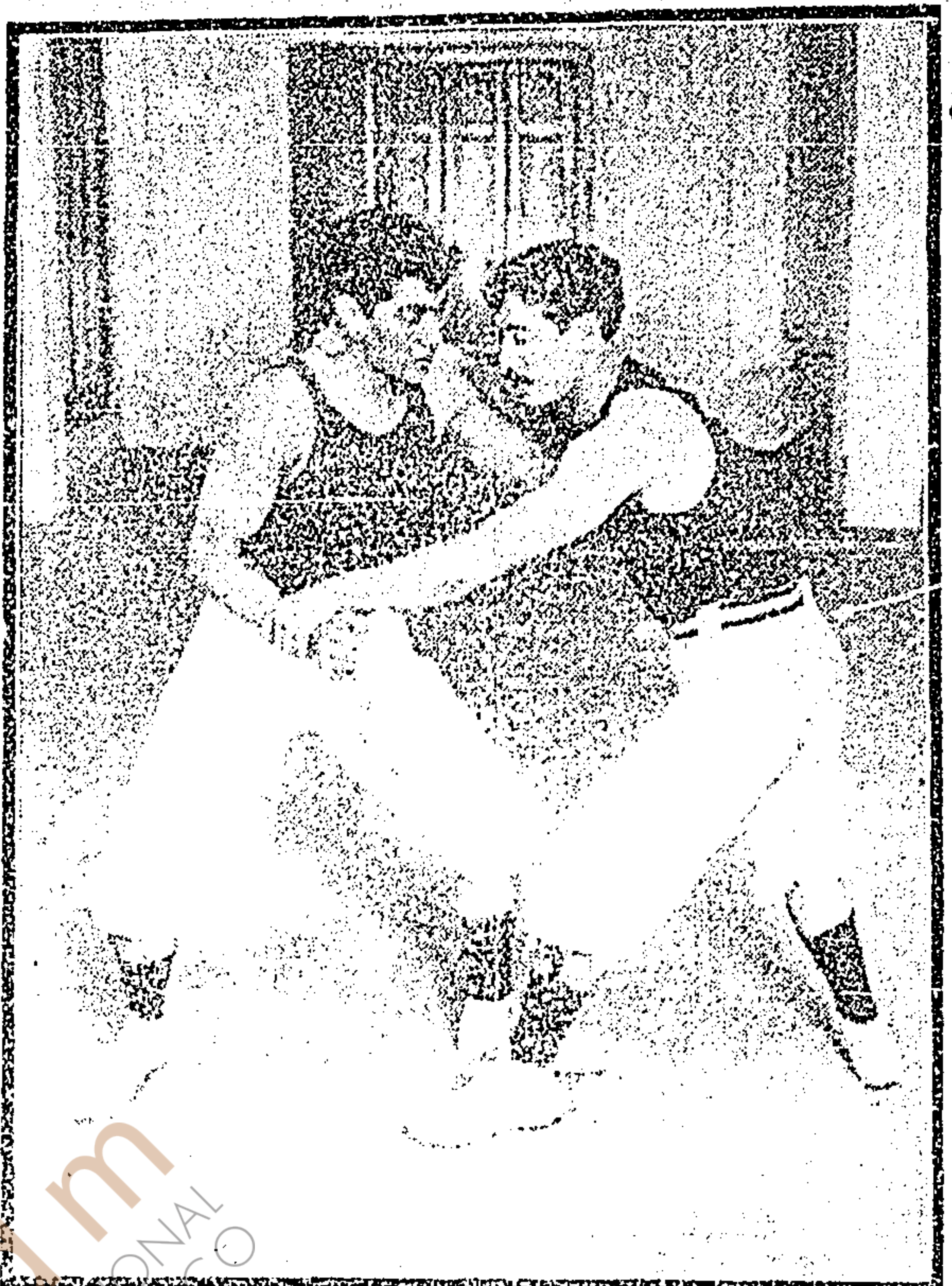
Fiesta en la Asociación Cristiana de Jóvenes a beneficio de la "Cruz Blanca." La lucha greco romana.