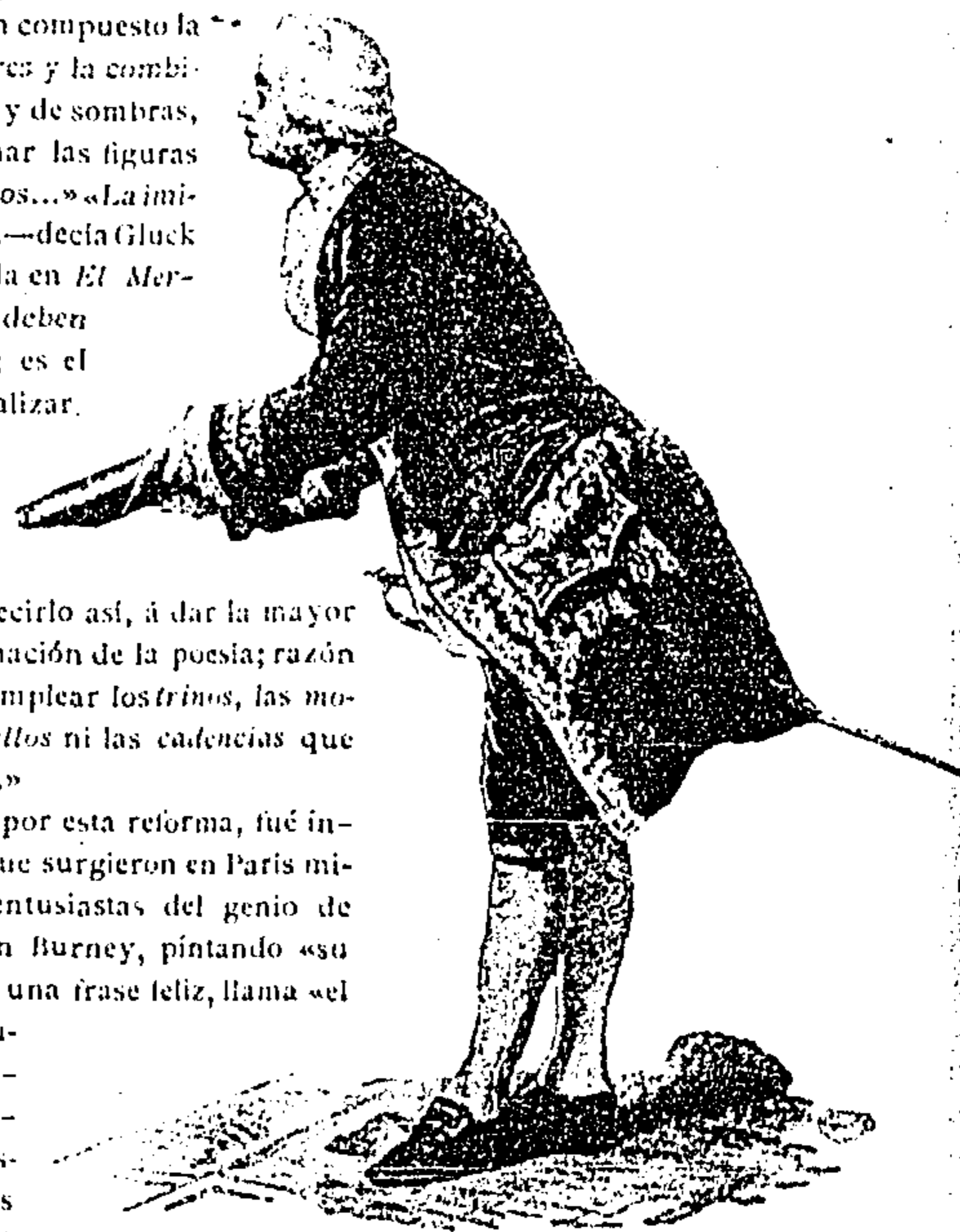
Gluck.—Figura del cuadro de Hamman «Gluck en el Trianon»

El éxito alcanzado por esta reforma, fué inmenso; pero á la vez que surgieron en París miles de admiradores entusiastas del genio de aquel maestro, á quien Burney, pintando «su manera» vigorosa con una frase feliz, llama «el Miguel Angel de la música», también aparecieron enemigos y detractores, que para hostilizarlo dedicaron sus aplausos y sus elogios á otro músico notable,