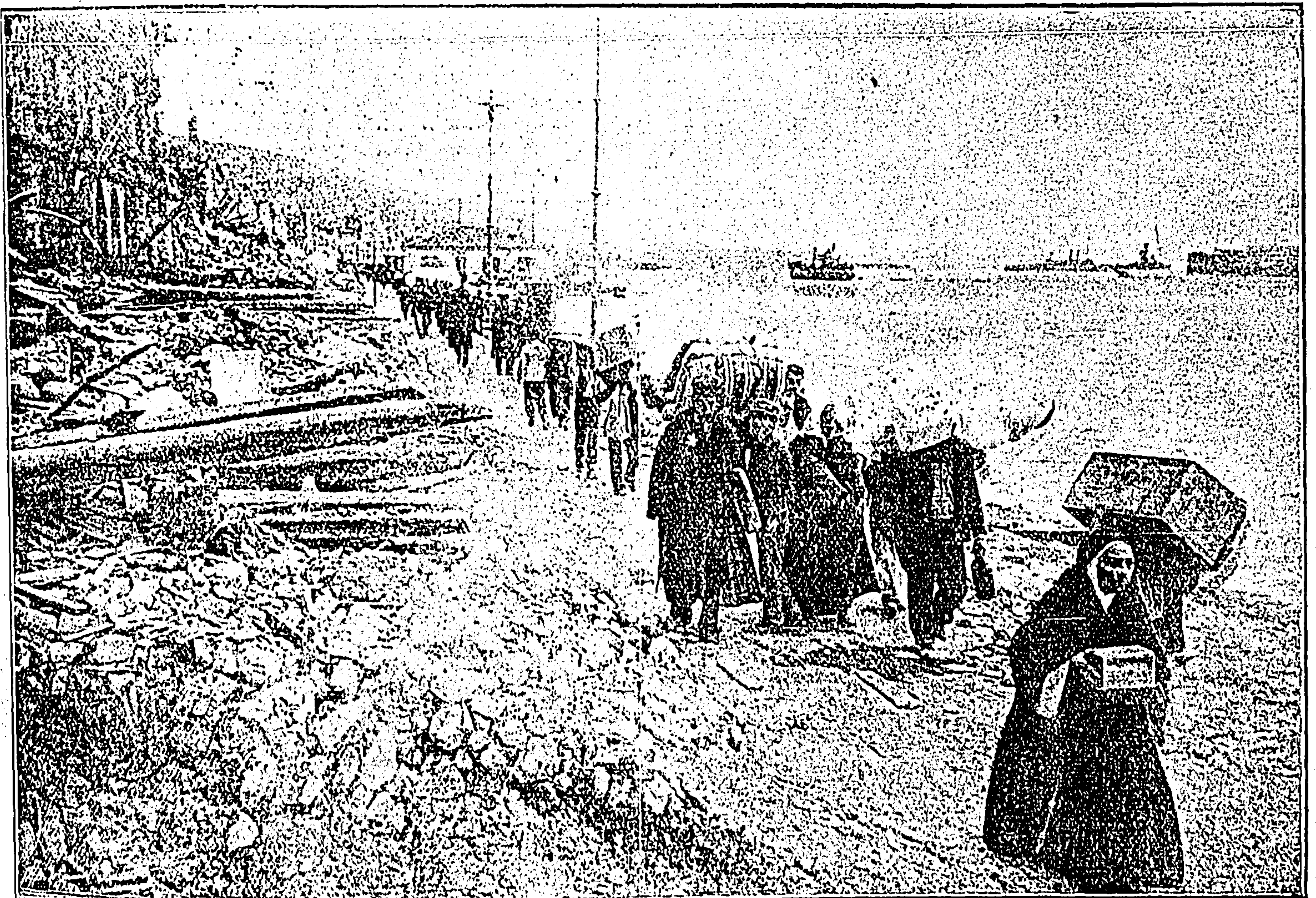
EN MESSINA —El éxodo.

Creemos que á todo esto y á más estamos obligados en vista del creciente y constante favor que el público nos dispensa, y como estamos seguros, y confiados de que así será en lo de adelante, nos prometemos no desmayar.