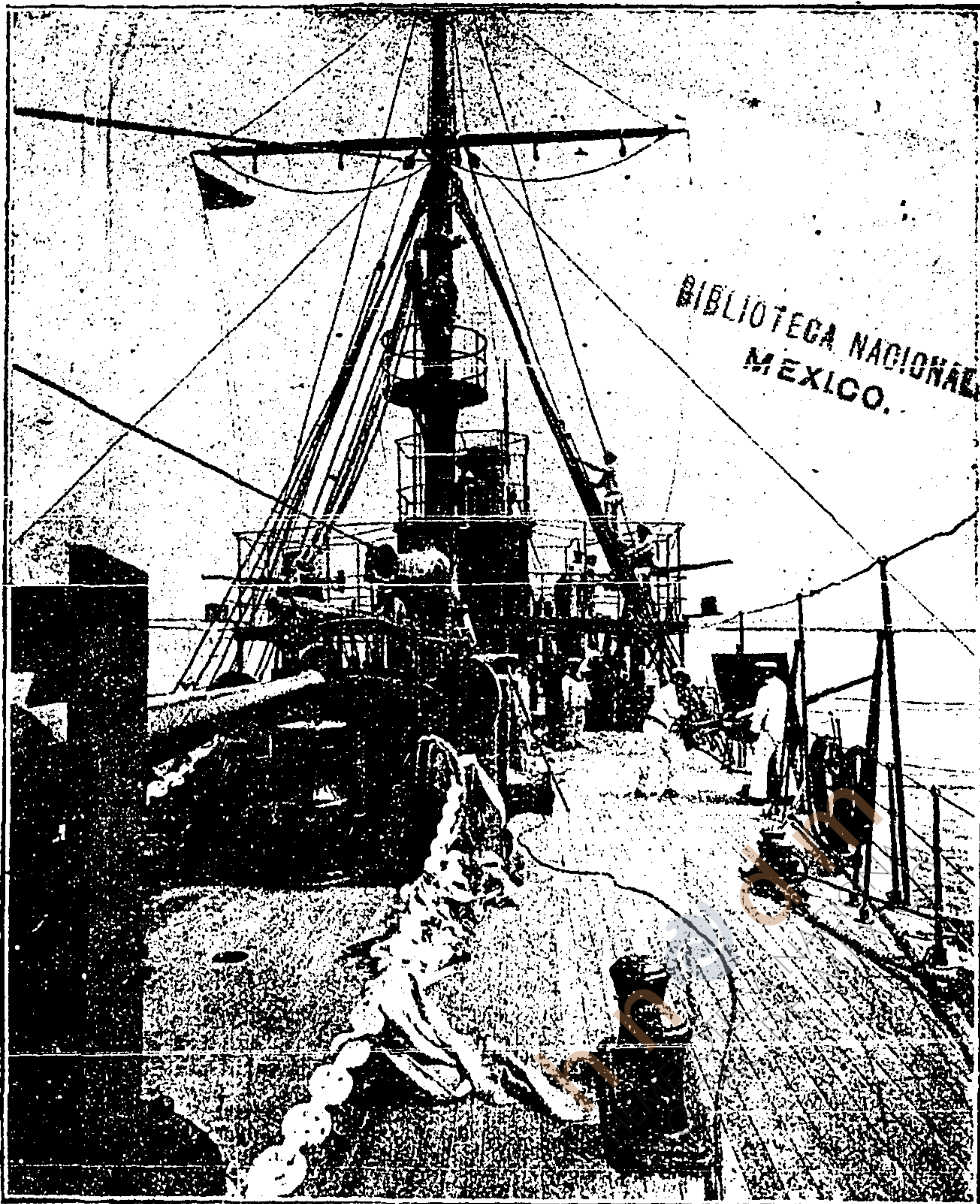
Cañonero "Morelos," que estaba en Tampico y ha recibido órdenes de trasladarse a Puerto México.