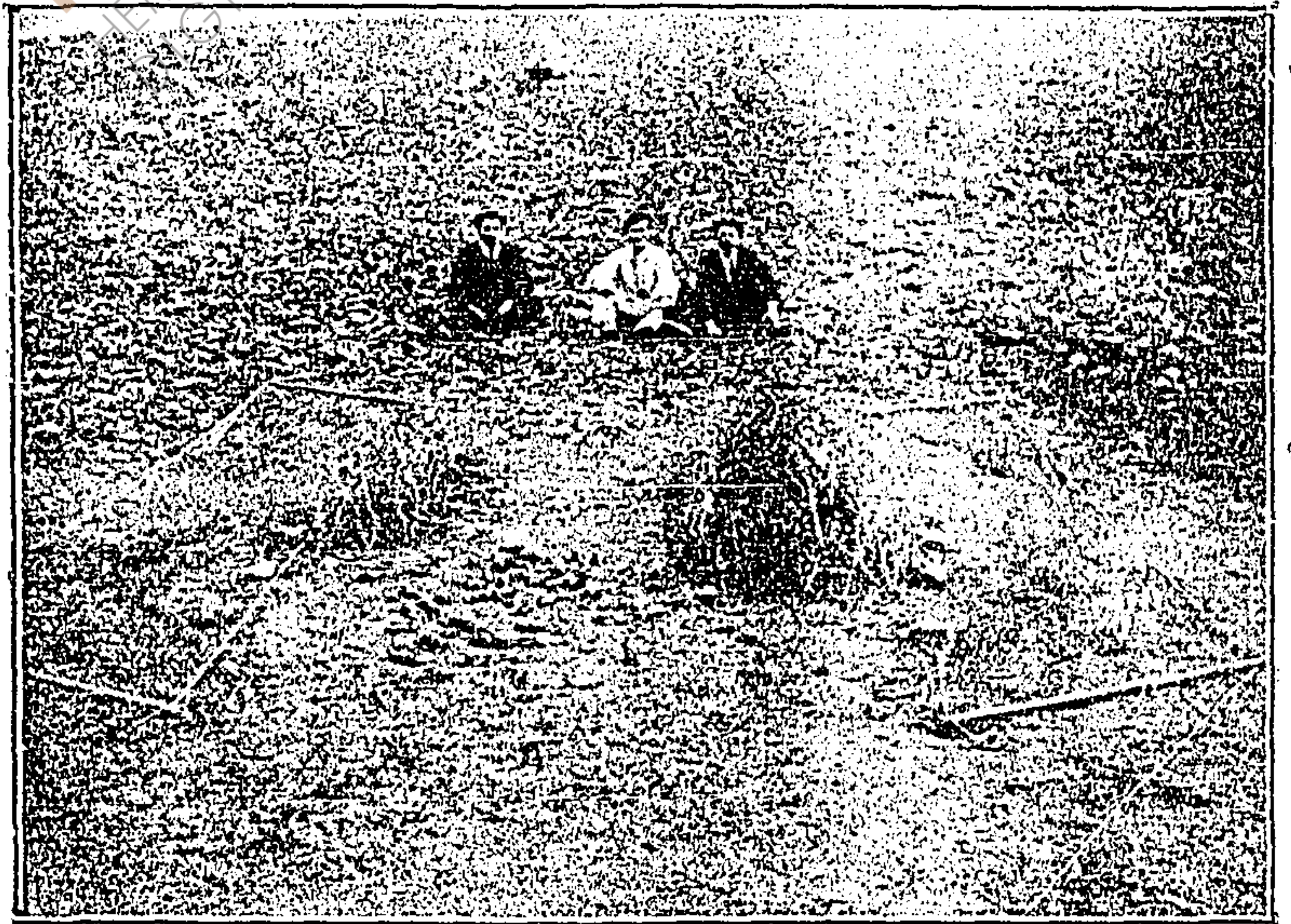
FORMA EN QUE QUEDA LA RED DESPUÉS DE ABIERTA. EN EL CENTRO SE VEN LOS PÁJAROS QUE HAN CAIDO EN ELLA