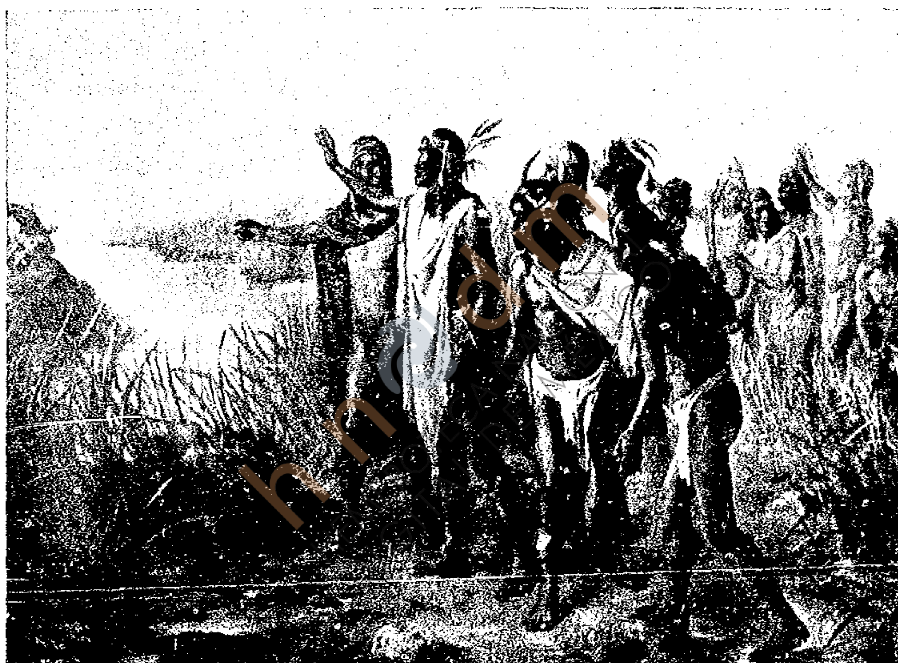
EL ORIGEN DE LA FUNDACIÓN DE MÉJICO.

¡Feliz coincidencia! ¡quién creyera que este periódico preparado hace muchos meses iba á aparecer al abrirse la Exposición de Bellas Artes! Felicitamos á los organizadores de un certamen deseado por tanto tiempo y que so-