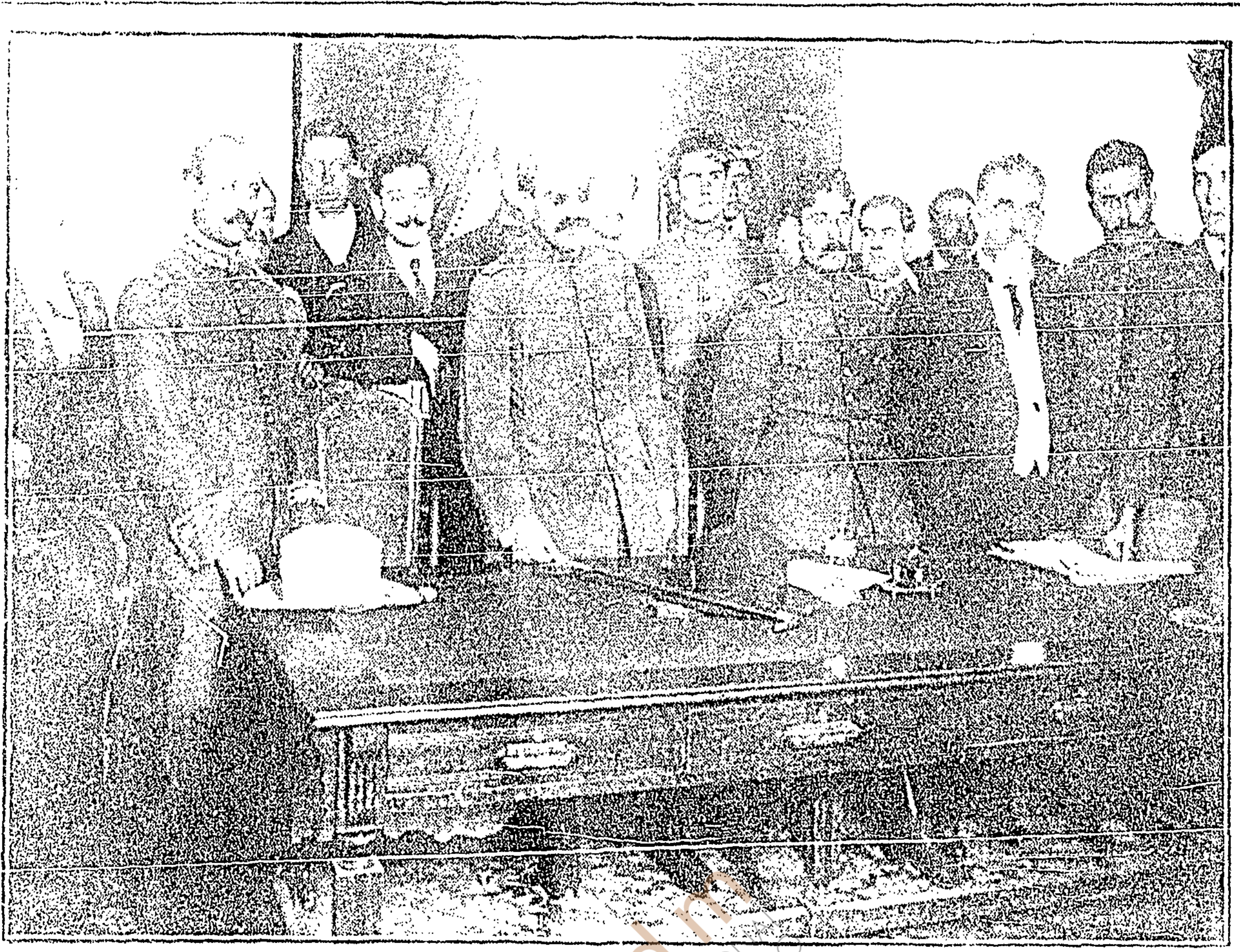
El Sr. [illegible] y el Sr. [illegible] con los señores [illegible] y [illegible] en el momento de la toma de posesión del nuevo [illegible].