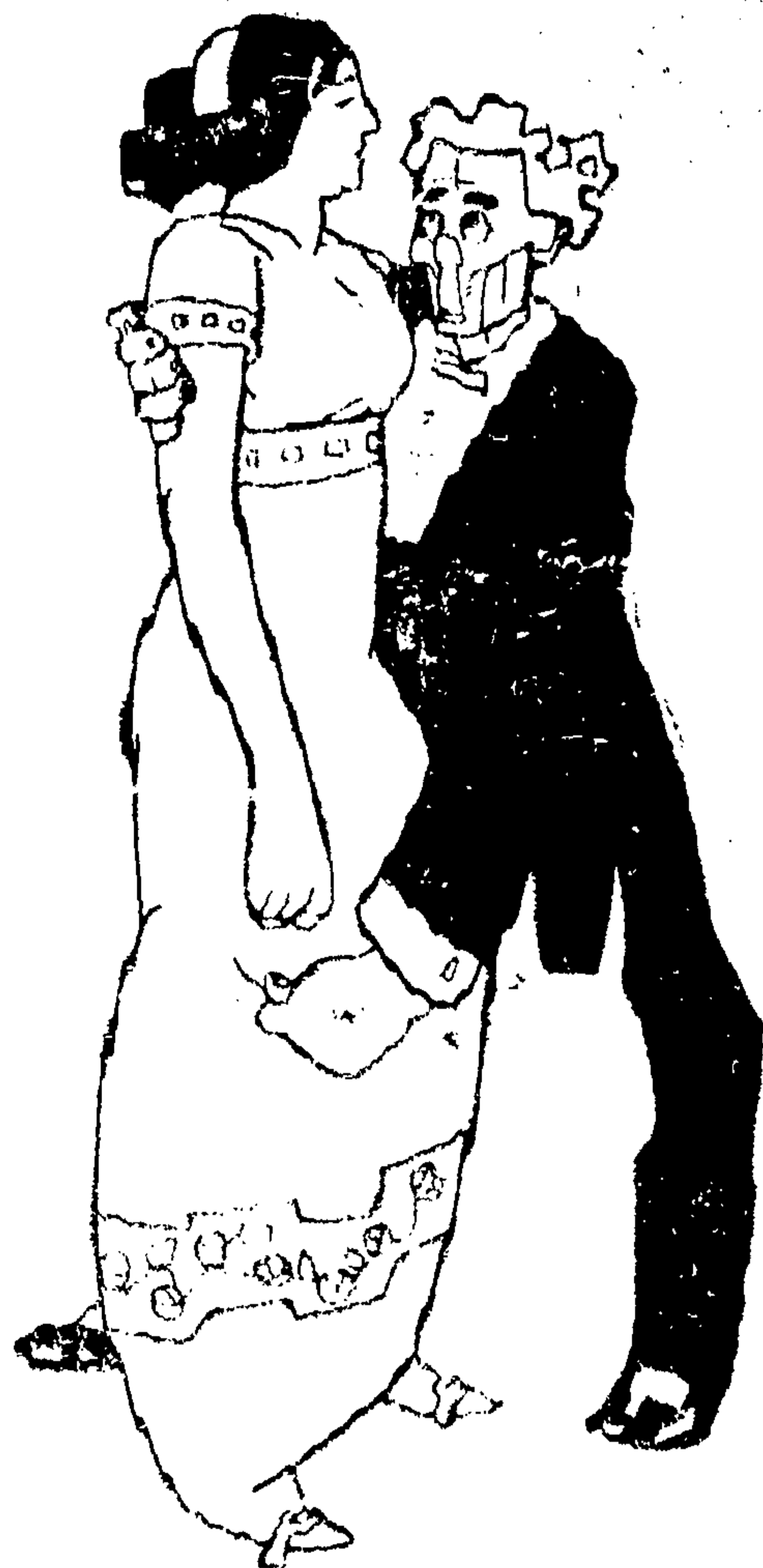
Este charito, señor, La verdad es muy... unador

Los Cigarros de la Tabacalera Mexicana, han obtenido el primer premio en la Exposición de San Luis Missouri.