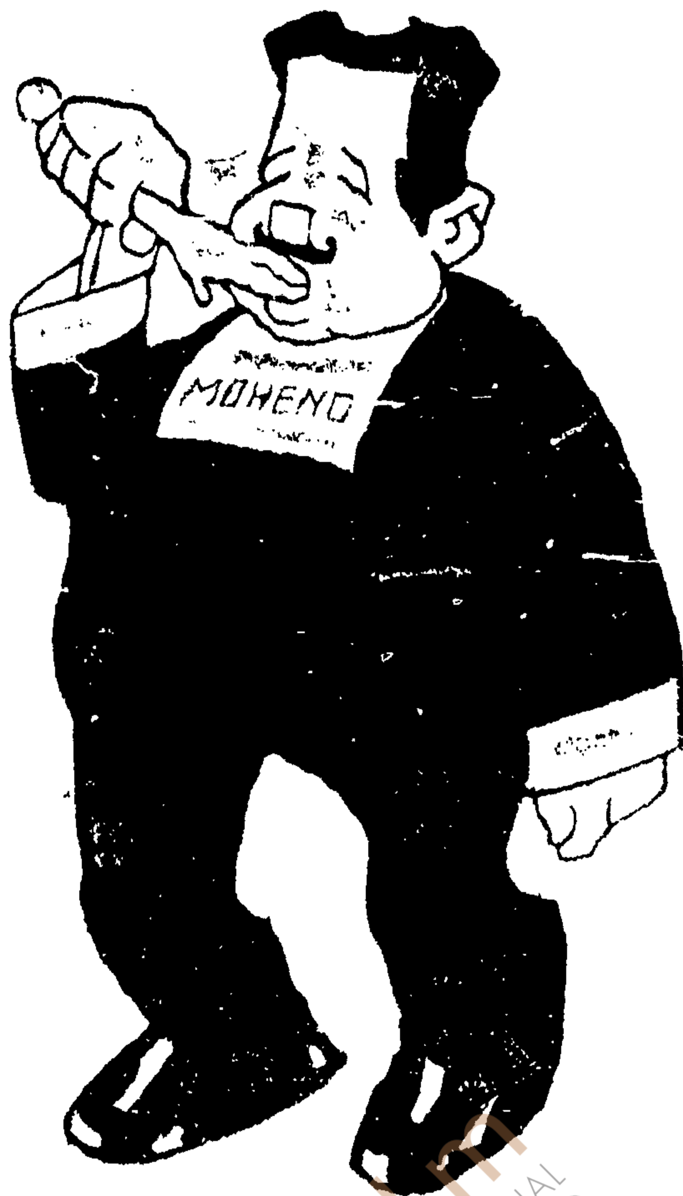
Para que no pierda peso. No llora... como su libreso.