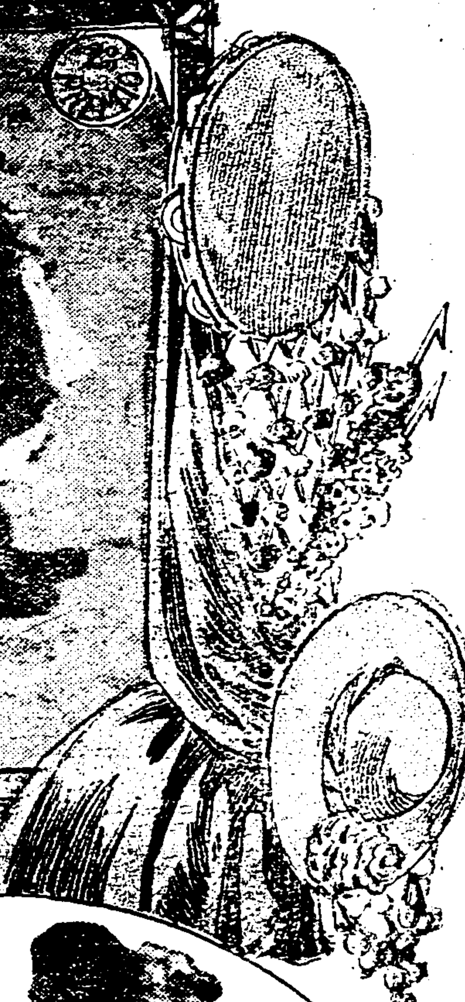
Un quite de los matadores a "Farfan"