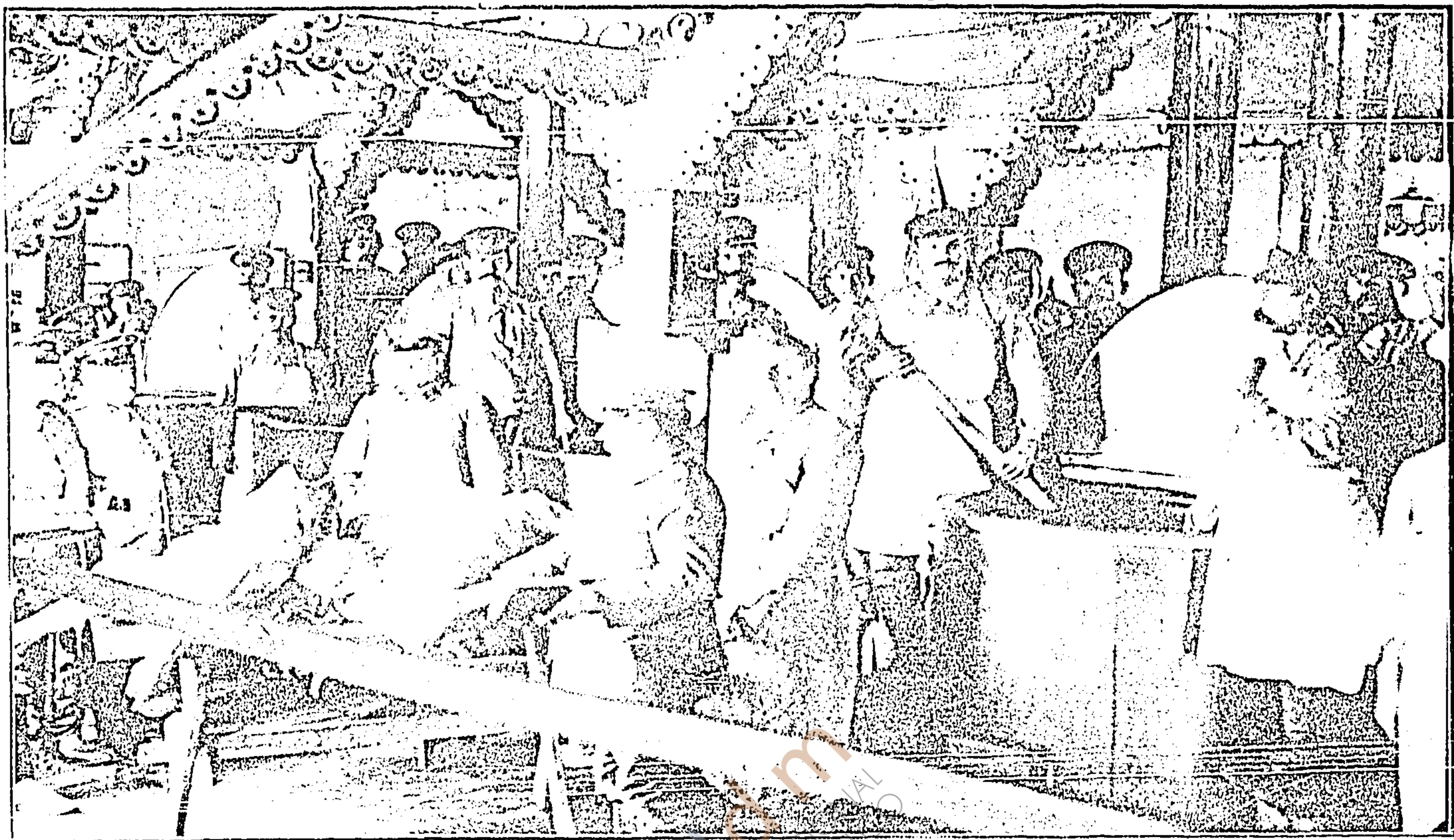
Cocina en el campamento de Doeberitz.