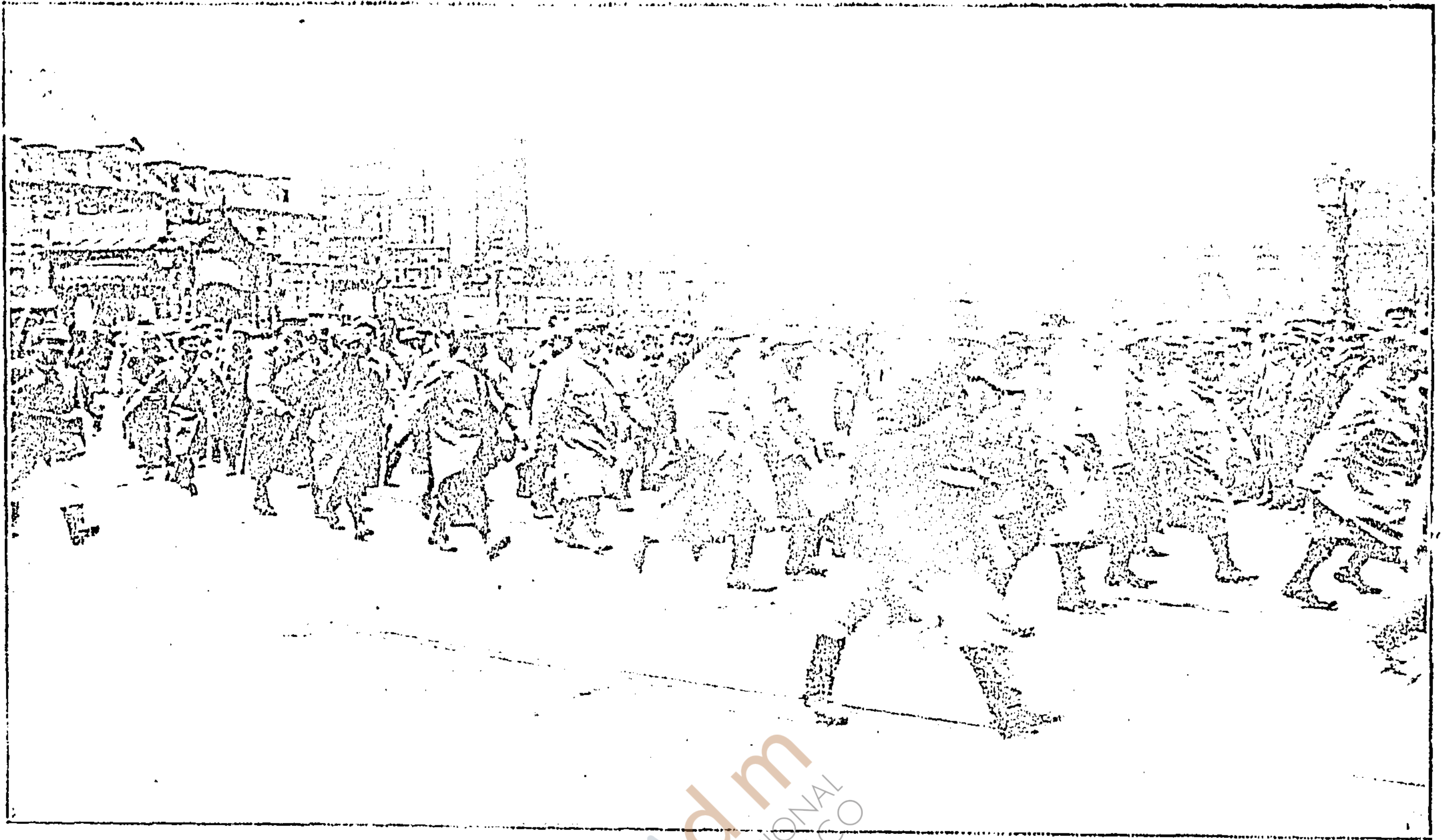
Transporte de prisioneros franceses por la ciudad de Lille, ocupada por los alemanos. Los prisioneros pasando por la Grande Place