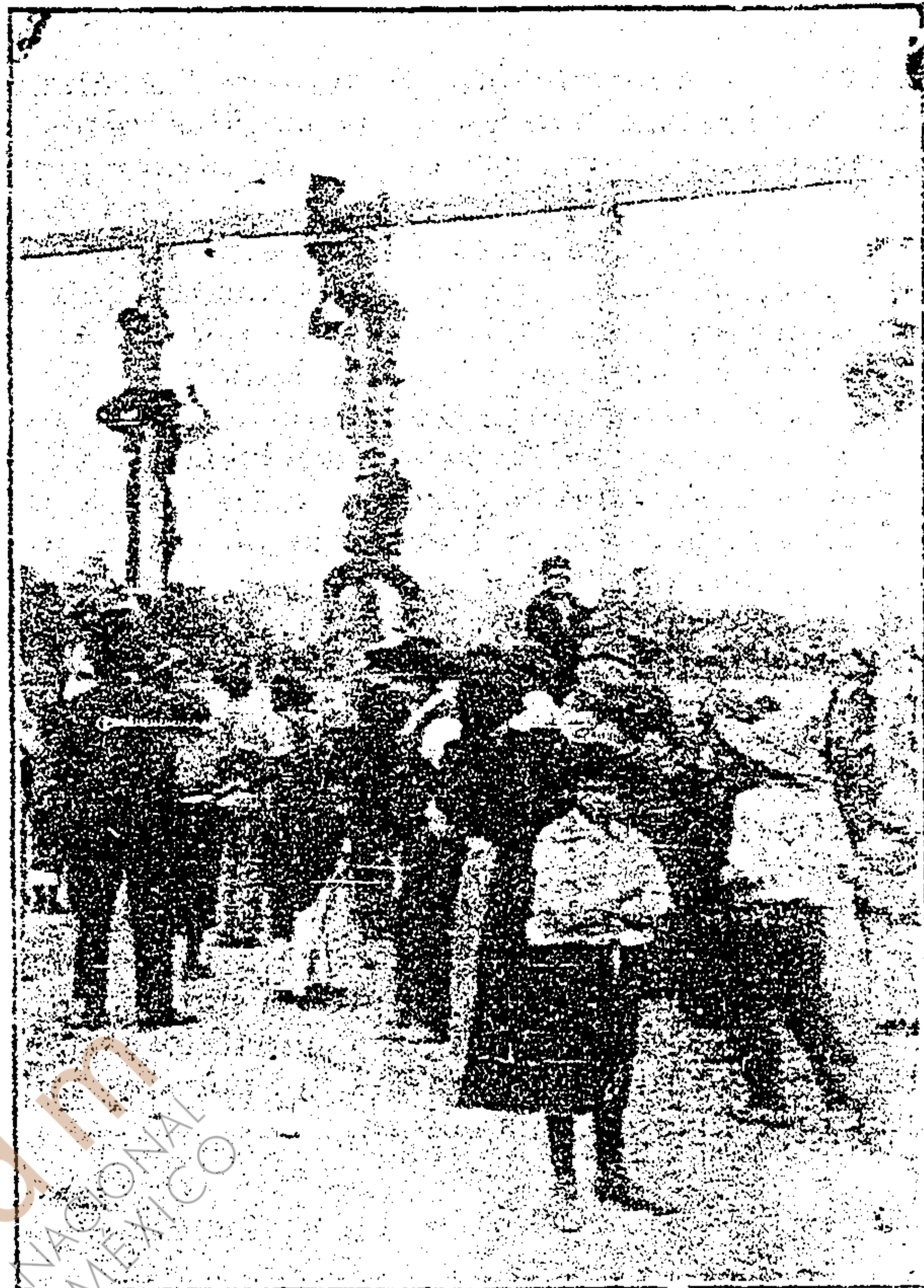
La concurrencia en el parque obrero

con los espectáculos y las barras, trapecios y cuerdas allí instalados. Publicamos una fotografía del simpático festival.