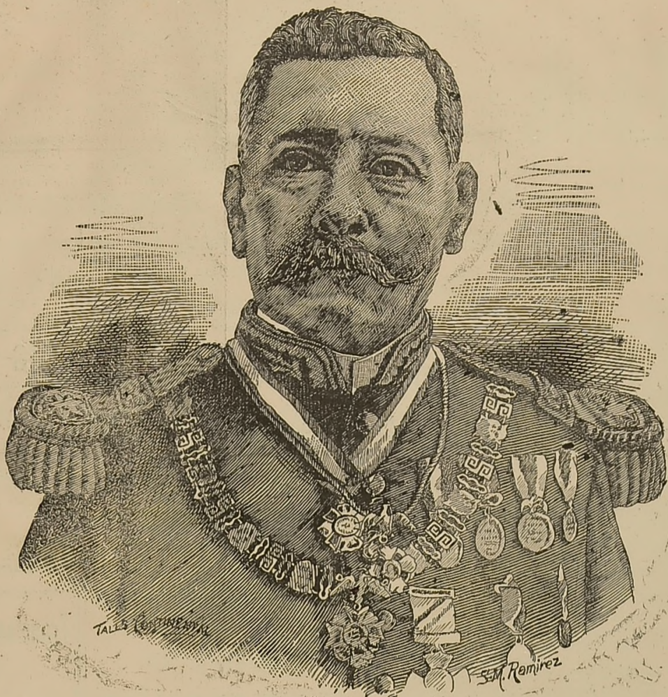
"EL 2 DE ABRIL" como homenaje de admiración al primer Magistrado de la República, C. GENERAL PORFIRIO DIAZ.