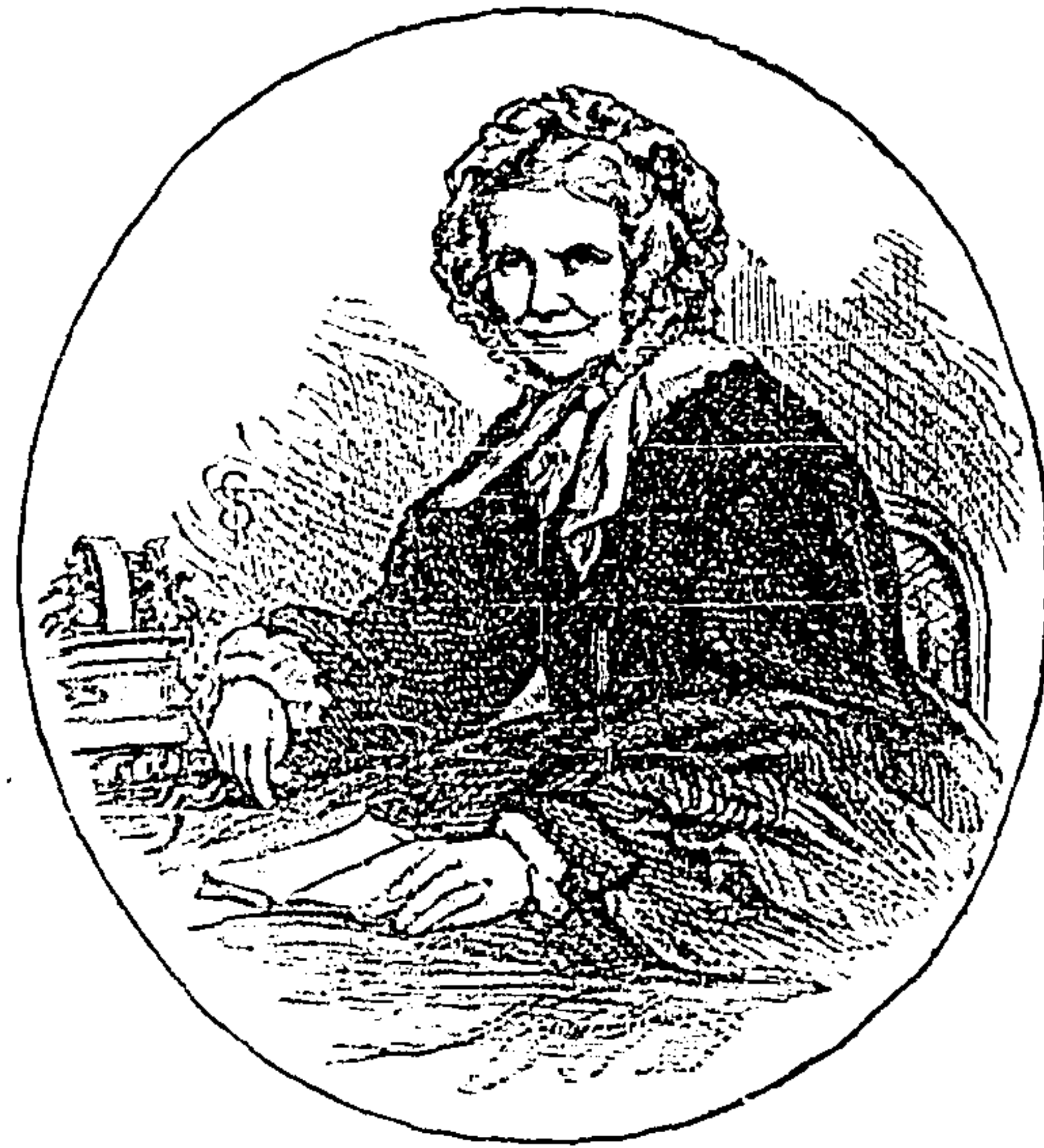
JORGE ELIOT, CELEBRE LITERATA INGLESA